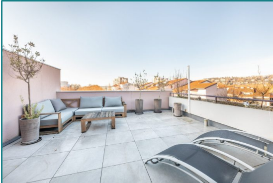
Terrasse roof top